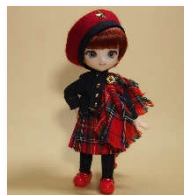
キルト衣装セット