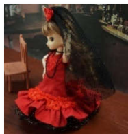
フラメンコ： 黒ベールとパタデコアラ

ミラドールの衣装には、ほかに以下のような作品がございます。機会がありましたらぜひお手に取ってごらんくださいませ