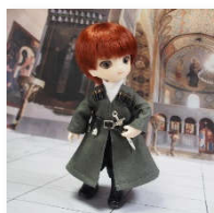
グルジア衣装： カルトリの戦士